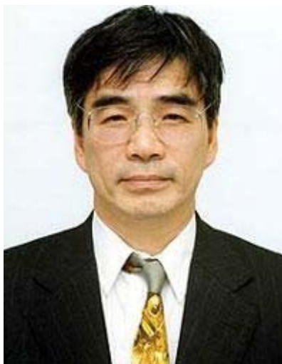
加藤正夫为中日围棋的交往作出了很大贡献

老聂也还是奋起神勇，先杀小林觉，再砍羽根泰正，在次形成了双方主帅一战定胜负的局面。可进入 90 年代的老聂已经没有当年的豪气了，再加之身体一向不好，下棋经常都要随时吸氧，两连胜后终于倒在了日本传奇人物加藤正夫的刀下，加藤正夫也用这一胜报了以前的仇，为自己正了名。同时，这一届也是最后一次双方主帅的碰面，在以后的数届比赛里，双方虽然互有胜负，但都没有将所有盘数下满过。