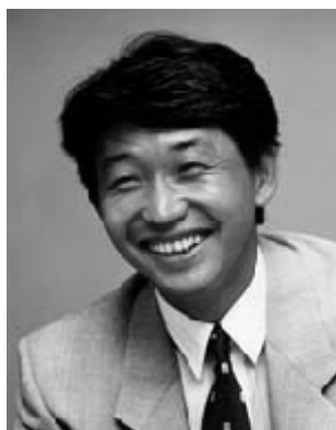
小林觉可让我们吃了不少苦头

这届比赛一开始，双方不约而同地都派出了女将当先锋，代表中国的是芮乃伟，代表日本的是楠光子。芮乃伟自然不用谈，多年来独霸女子围棋界，少有人能撼动，1992年，她打入了第二届应氏杯的四强，这个女棋手在国际大赛上的成绩至今无人能够打破。更为辉煌的是在随丈夫江铸久去韩国下棋后，在2000年以女棋手进入男子比赛较量，二比一战胜曹薰铉夺得韩国第43届国手战冠军，且对世界上最多的世界冠军得主李昌镐胜多负少。但楠光子也不是易与之辈，她可是当时日本的女子“本因坊”。这场女将之间的战斗以芮乃伟的胜利而告终，跟着芮乃伟继续好调，再砍森田道博于马下，只是在第三场比赛里惜败于今村俊也。在第四场今村俊也战胜中国另一位女将张璇（常昊的夫人），第五场钱宇平战胜今村俊也这两局波澜不惊的比赛后，日本又一个小林开始了他的表演，不过不是上届的那个小林光一，而是小林觉。小林觉一上来，就一扫第一届出场就败北的颓势，连杀中国钱宇平、邵震中、曹大元、江铸久和刘小光五人，直到马晓春出马才遏止了他的势头。可老马也没能乘胜追击，跟着就被片冈聪打下擂台，片冈聪将直接挑战中国的光杆司令聂卫平。