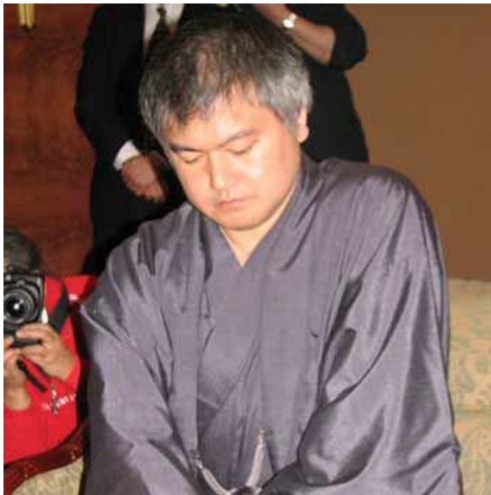
依田纪基的棋风与大部分日本棋手不一样

双方一开战，又一连胜猛人闪亮登场，此人就是现在依然活跃在棋坛的“老虎”依田纪基。当时的依田纪基虽然没有大棋战的头衔在手，但他是日本的新人王，他同时创下的是中日围棋擂台赛先锋的最佳战绩——六连胜。几乎就靠他一个人的力量将中国队横扫，俞斌、陈临新、王群、刘小光、江铸久、马晓春这些，无论是老将还是新锐，全都成了他的手下败将，直接杀到了聂卫平面前。