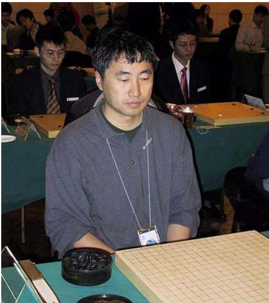
江铸久赛场的英姿

当时的聂卫平可以说是中国围棋最出色的棋手，面对以一对三的局面毫无惧色。在与小林光一比赛前他就发出了豪言壮语，凭小林光一那几手，自己这关他过不了。最后的战局也印证了他的豪言，小林光一的疯狂表演到此结束，聂卫平完成了他在中日围棋擂台赛上的首胜。然而后面还有两位日本棋手，加藤正夫和藤泽秀行，前者是当时日本的王座头衔拥有者，后者是当时日本的棋圣头衔拥有者，可以说都是当时日本棋界数一数二的人物。加藤正夫刚出道时棋风彪悍，号称“天煞星”，到后期有所改变，当时只有 38 岁的他在日本也可以说是如日中天，在此之前聂卫平从来没有战胜他的记录。可当时的聂卫平挟战胜小林光一的余威，气势如虹，最后战而胜之，终于得到了和日本主帅藤泽秀行一较高下的机会。藤泽秀行前辈可以说为中日的围棋交流做出过很大的贡献，多次率团访问中国，与聂卫平对阵时已经 60 岁的高龄了。他的棋力如何不用任何质疑，聂卫平自己都曾经说过，藤泽秀行的前 50 手棋绝对的天下第一。但当时的聂卫平已经疯了，连胜日本两大高手给了他极大的信心，在一场没有多大起伏的战斗后，聂卫平用自己的胜利终结了第一届中日围棋擂台赛，让包括中国在内的很多人跌破了眼镜。日本围棋界也把这个失败当成了奇耻大辱，赛后多人剃光头明志，期待在第二届比赛里卷土重来。